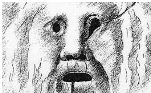
Canta Tito Tazio

Nella sfida dell'uno contro tutti ha vinto la signora candidata. Volenno sfanculà li farabutti la gente ar ballottaggio l'ha votata. Dopo questa tortorata l'aria pare ch'è cambiata. E co sti venti speramo ne le cose più decenti.